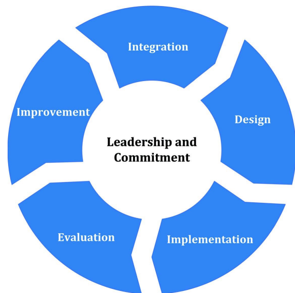
Abb. 2: Rahmen

Die ONR 49001 baut auf der ISO 31000 auf und beinhaltet deren Umsetzung für Organisationen und Systeme in der Praxis. Derzeit wird die ONR 49001 auf Basis der neuen ISO 31000 überarbeitet. Voraussichtlich sollte diese im Laufe des Jahres 2018 erscheinen.